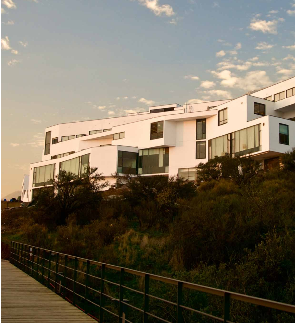
SEDE UAI SANTIAGO / PEÑALOLÉN